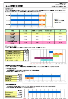
「McSS 経営診断報告書」イメージ図

《問い合わせ先》 〒651-0195 神戸市中央区浪花町 62-1 経営支援部 再生発展支援課 Tel : 078-393-4024 Fax : 078-393-3980 Email : keieisien@hosyokyokai-hyogo.or.jp