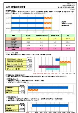
「McSS 経営診断報告書」イメージ図

《問い合わせ先》 〒651-0195 神戸市中央区浪花町 62-1 経営支援部 支援推進課 Tel : 078-393-4024 Fax : 078-393-3980 Email : keieisien@hosyokyokai-hyogo.or.jp